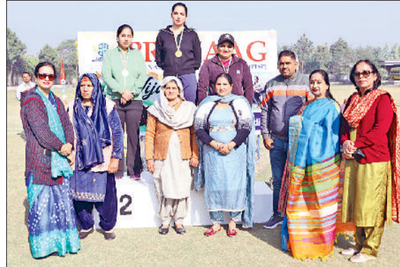
पानीपत। प्रयाग स्कूल में मेधावी विद्यार्थी, शहीदों के परिजनों के साथ।

यह मौका दिया कि हम उन बुजुर्गों के लिए कुछ