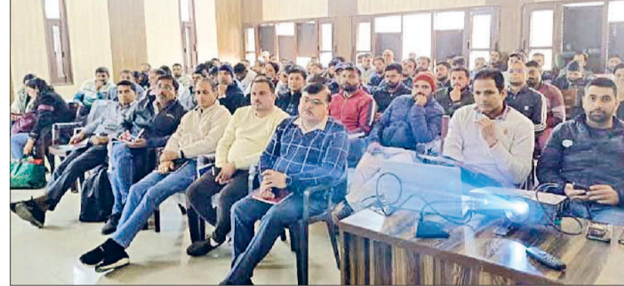
करनाल। डिजिटल एग्रीकल्चर मिशन को लेकर आयोजित प्रशिक्षण बैठक में प्रतिभागी।

करनाल। जिले में डिजिटल एग्रीकल्चर मिशन 2024 को प्रभावी रूप से लागू करने की दिशा में प्रशासन ने प्रक्रिया तेज कर दी है। उपयुक्त के निर्देशानुसार भारत सरकार के विजन के अनुरूप एग्री-स्टैक डिजिटल पब्लिक इंफ्रास्ट्रक्चर को जमीन पर उतारने के लिए प्रशिक्षण बैठक आयोजित की गई।