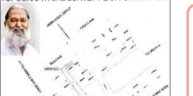
प्रस्तावित अंडरपास का लेआउट।

अंबाला छावनी में आमने-सामने स्थित बस स्टैंड व रेलवे स्टेशन के मध्य पैदल आने-जाने की राह अब पहले से सुगम व आसान होगी। जीटी रोड के नीचे आधुनिक अंडरपास का निर्माण किया जाएगा जिससे लाखों यात्रियों व स्थानीय लोगों को सुविधा मिलेगी। मंत्री अनिल विज ने बताया कि नेशनल हाइवे ऑथोरिटी ऑफ इंडिया द्वारा रेलवे स्टेशन व