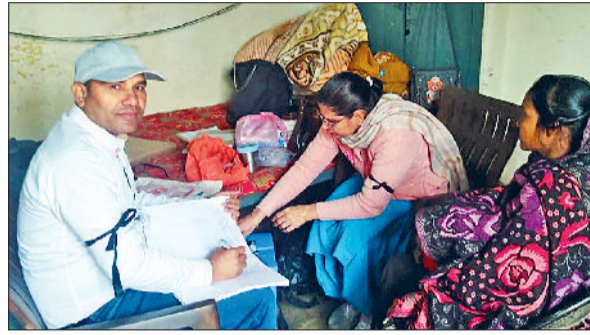
कुरुक्षेत्र। काली पट्टी बांध रोष जताते स्वास्थ्य कर्मचारी।

प्रदेशभर के कर्मचारियों ने सरकार की नीतियों के खिलाफ मोर्चा खोल दिया है और अपनी नाराजगी जतानी भी शुरू कर दी है। कहीं मांगों को लेकर प्रदर्शन किया जा रहा है तो कहीं ऑनलाइन ट्रांसफर पॉलिसी का विरोध किया जा रहा है। बुधवार को कुरुक्षेत्र में बहुउद्देशीय स्वास्थ्य कर्मचारी संगठन ने काली पट्टी बांधकर विरोध जताया। वहीं करनाल, पानीपत, समालखा और मुलाना में बिजली कर्मचारियों ने ऑनलाइन तबादला नीति को लेकर विरोध जताते हुए प्रदर्शन किया। कुरुक्षेत्र में बहुउद्देशीय स्वास्थ्य कर्मचारी संगठन ने हरियाणा के आह्वान पर जिला कुरुक्षेत्र में स्वास्थ्य विभाग में विशेष टीकाकरण सप्ताह को जिला कार्यकारिणी कुरुक्षेत्र ने काले रंग की पट्टी बांधकर विरोध जताया गया। यह कदम सरकार द्वारा