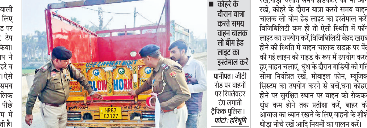
पानीपत। जीटी रोड पर वाहनों पर रिफ्लेक्टर टेप लगाती ट्रैफिक पुलिस।

इसके अलावा वाहनों के बीच उचित दूरी बनाए रखें, गाड़ी चलाते समय इंडिकेटर को भी आँ रखें, कोहरे के दौरान यात्रा करते समय वाहन चालक लो बीम हेड लाइट का इस्तेमाल करें, विजिबिलिटी कम हो तो ऐसी स्थिति में फॉग लाइट का उपयोग करें, विजिबिलिटी बेहद खराब होने की स्थिति में वाहन चालक सड़क पर पेंट की गई लाइन में वाहन चालक सड़क पर पेंट की गई लाइन को गाइड के रूप में उपयोग करते हुए वाहन चलाएँ, धुंध के दौरान गाड़ियों की गति सीमा नियंत्रित रखें, मोबाइल फोन, म्यूजिक सिस्टम का उपयोग करने से बचें, घना कोहरा होने पर सुशिक्षित स्थान पर वाहन को रोककर धुंध कम होने तक प्रतीक्षा करें, बाहर की आवाज का ध्यान रखने के लिए वाहनों के शीशे थोड़ा नीचे रखें आदि नियमों का पालन करें।