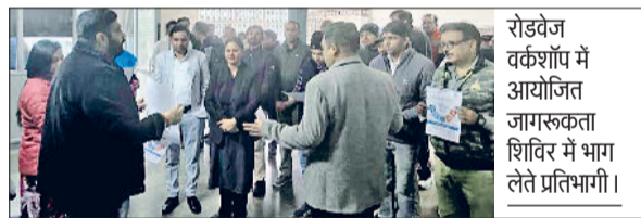
रोडवेज वर्कशॉप में आयोजित जागरूकता शिविर में भाग लेते प्रतिभागी।

जिला विधिक सेवा प्राधिकरण द्वारा 100 दिवसीय बाल विवाह मुक्त भारत अभियान के तहत जिले के विभिन्न स्थानों पर जागरूकता शिविर आयोजित किए जा रहे हैं। इसी क्रम में हरियाणा रोडवेज करनाल की वर्कशॉप में रोडवेज स्टाफ और विद्यार्थियों के लिए जागरूकता शिविर का आयोजन किया गया। शिविर में पैनल