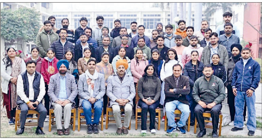
करनाल। हरियाणा ग्रामीण विकास संस्थान में पोर्टल आधारित प्रशिक्षण कार्यक्रम में उपस्थित अधिकारी व अन्य।

बोले, अब प्रधानमंत्री मोदी द्वारा एक बटन दबाते ही किसान सम्मान निधि की राशि सीधे लाभार्थियों के बैंक खातों में पहुंच जाती है।