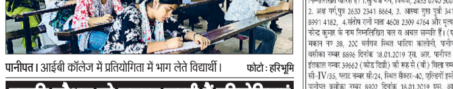
पानीपत। आईबी कॉलेज में प्रतियोगिता में भाग लेते विद्यार्थी।